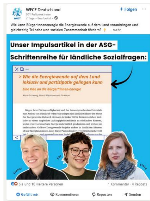
Abb. 4: LinkedIn-Post von WECF Deutschland