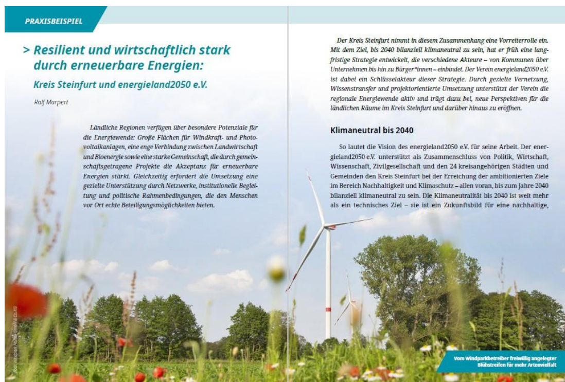
Abb. 1: Layout eines Praxisbeispiels

Auch das Layout wurde im Vergleich zur Vorgängerpublikation („Abhängig Beschäftigte in der Landwirtschaft“, ASG-Schriftenreihe für ländliche Sozialfragen Nr. 149) deutlich aufwändiger gestaltet. Neben reinem Text wurden Definitionskästen, graphisch aufbereitete Zitate, Graphiken und Fotos eingebunden (vgl. Abb. 1). Die ansprechende Gestaltung führt zu einer deutlich größeren Anschaulichkeit und einem besseren Leseerlebnis und stieß auf viel positives