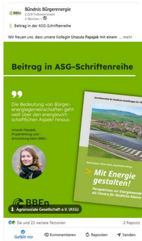
Abb. 6: LinkedIn-Post von Bündnis Bürgerenergie e.V.