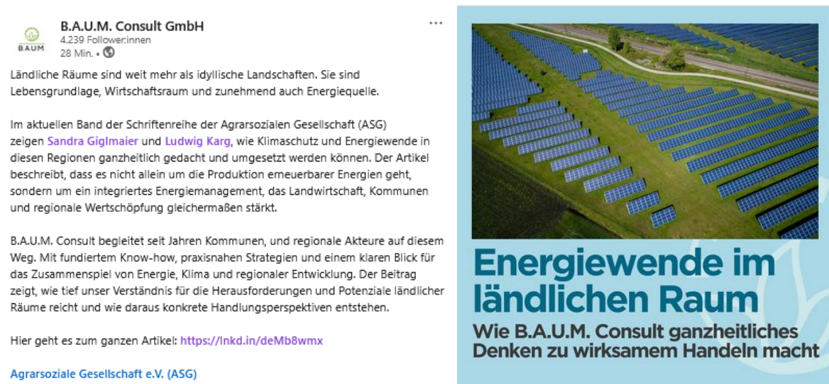
Abb. 7: LinkedIn-Post von B.A.U.M. Consult GmbH