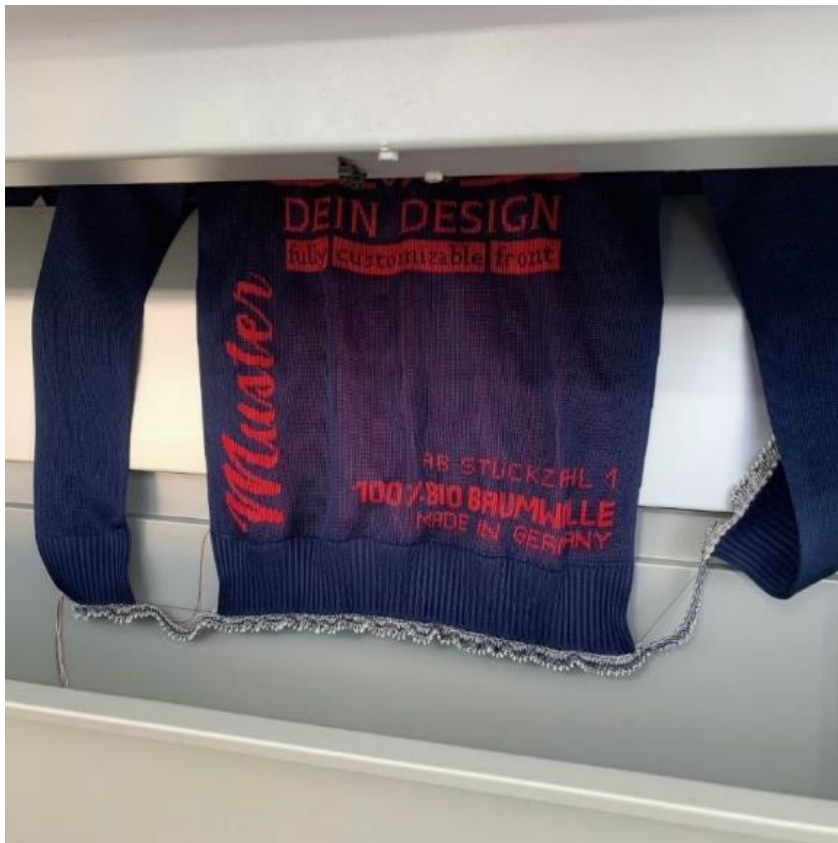
Abbildung 2: Individualisierbare 3D Pullover im Produktionsprozess

Im Rahmen des Projektes wurde daher in Kooperation mit der KARL MAYER STOLL Textilmaschinenfabrik GmbH ein 3D Strickpullover entwickelt. Die eingesetzte Knit & Wear Technologie ermöglicht die automatisierte Produktion in nur einem Vorgang. Im Gegensatz zu herkömmlicher Produktion mit Meterware entfällt das manuelle Zusammennähen der einzelnen Teilbereiche. In Abbildung 2 ist ein individualisierbarer 3D Pullover im direkten Produktionsprozess der Strickmaschine zu sehen.