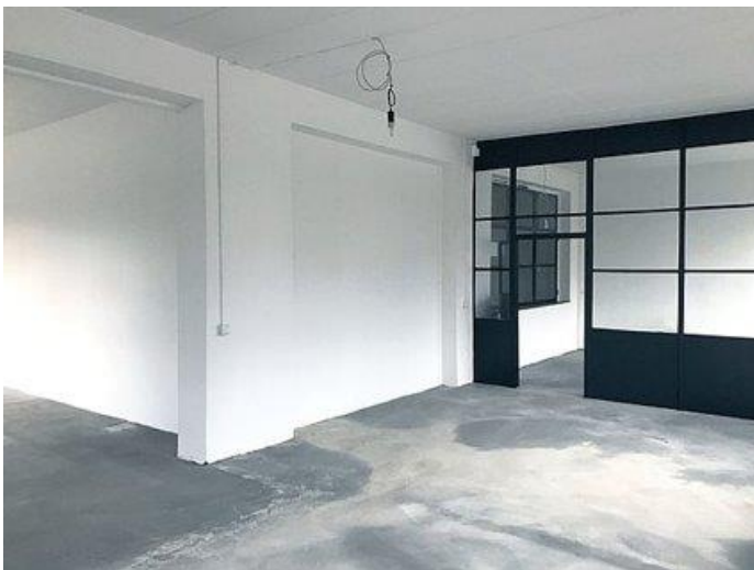
Abbildung 4: Leere Büroräumlichkeiten zu Projektbeginn

Zum Aufbau der Produktion wurden Büroräumlichkeiten angemietet, die sich in einen Büroraum und eine gewerbliche Produktionsfläche aufteilen (siehe Abbildung 4).