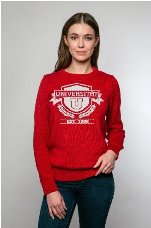
Abbildung 3: Individualisierbarer Pullover in Strickoptik simuliert

Die eingesetzte 3D Technologie reduziert das zeitintensive, repetitive und manuelle Zusammennähen. Zudem wird kaum Verschnitt produziert, während beim herkömmlichen manuellen Zusammennähen ca. 25% der Materialien während dem Produktionsprozess verloren gehen und als Abfall anfallen. 11 Darüber hinaus kann durch die digitale Integration eine automatisierte Individualisierung des Designs über die entwickelte Software abgebildet werden.