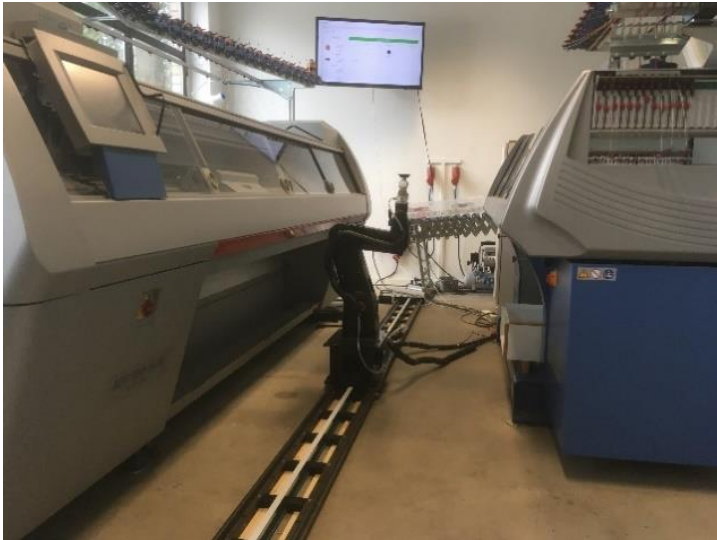
Abbildung 5: Vernetzte Produktion mit 3D Strickmaschinen, Roboter und digitalem Zwilling

Ein beispielhafter Prozess von Kundenorder, die über die Cloud und eine VPN Verbindung in den Produktionsbetrieb übertragen wird, und anschließender Produktion bis zum Versand sieht dabei wie folgt aus: