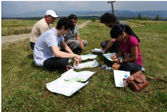
Abbildung 6 - Fotos von der Nachbereitung