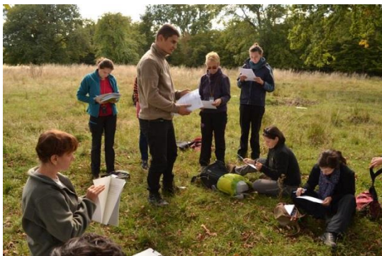
Abbildung 3 - Fotos aus dem Präsenzunterricht

Obwohl das Projekt ursprünglich zum Ziel hatte, die Länge des Präsenzunterrichts auf 3 bis 5 Tage zu reduzieren, war dies aufgrund der Komplexität der Lehrpläne nicht möglich. Tatsächlich wurde der Präsenzunterricht auf 12 Tage verteilt. Alle Teilnehmer bestanden die Abschlussprüfung und erhielten das offizielle Zertifikat. Die Teilnehmer hatten unterschiedliche Hintergründe und unterschiedliche praktische Arbeitsansätze. Es handelte sich um Beschäftigte von Schutzgebieten, Vertreter von Behörden, Lehrpersonal verschiedener Universitäten, Forstwirte und Mitarbeiter von NROs. Der Präsenzunterricht war sehr intensiv; die Teilnehmer erwarben dabei besondere Fertigkeiten für die effiziente Verwaltung von Naturschutzgebieten, lernten mit hochkomplexen Fragestellungen des Managements fertig zu werden, Techniken und Best Practices für Management und Kommunikation einzusetzen und systemweit Schlüsse aus Erfolgen und Misserfolgen zu ziehen.