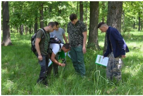
Abbildung 7 - Fotos vom Besuch der Universitäten und Exkursionen